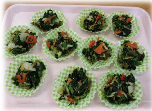
ほうれん草の磯和え

子どもたちが自分でおにぎりを握り、おかずとともにお弁当箱に詰めました。自分の思いとともに、詰めたお弁当を暖かな日差しのもと園庭でいただきました。